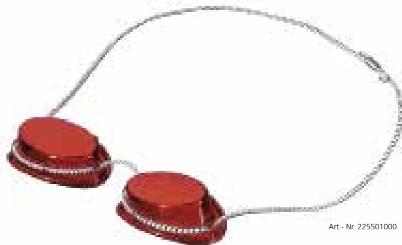
Art.- Nr. 225501000