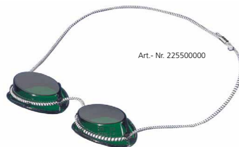
Art.- Nr. 225500000